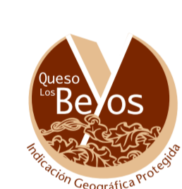
Queso Los Beyos (IGP) SUPRA-AUTONÓMICA