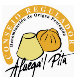
Afuega'l Pitu (DOP) ASTURIAS