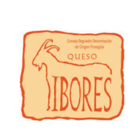
Queso Ibores (DOP) EXTREMADURA