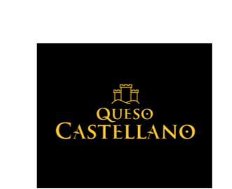
Queso Castellano (IGP) CASTILLA Y LEÓN