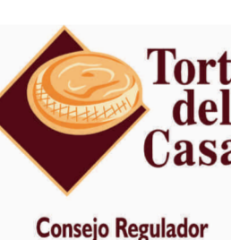
Torta del Casar (DOP) EXTREMADURA