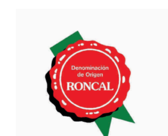
Roncal (DOP) NAVARRA