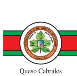
Cabrales (DOP) ASTURIAS