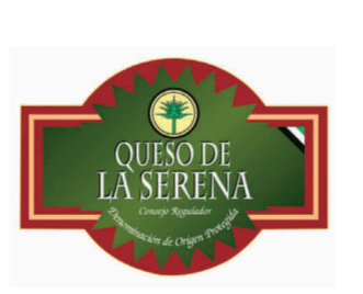
Queso de La Serena (DOP) EXTREMADURA