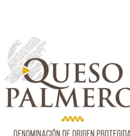
Queso Palmero / Queso de La Palma (DOP) CANARIAS