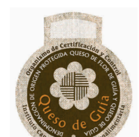
Queso de Flor de Guía / Queso de Media Flor de Guía / Queso de Guía (DOP) CANARIAS