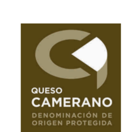
Queso Camerano (DOP) LA RIOJA