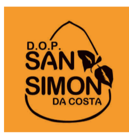
San Simón da Costa (DOP) GALICIA