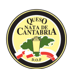
Queso Nata de Cantabria (DOP) CANTABRIA