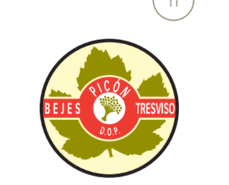
Picón Bejes-Tresviso (DOP) CANTABRIA