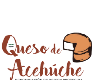
Queso de Acehúche (DOP) EXTREMADURA