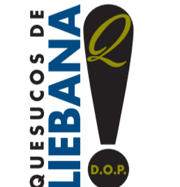
Quesucos de Liébana (DOP) CANTABRIA