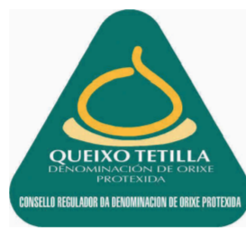
Queso Tetilla (DOP) GALICIA