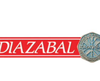
Idiazabal (DOP) SUPRA-AUTONÓMICA