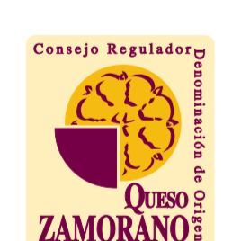
Queso Zamorano (DOP) CASTILLA Y LEÓN