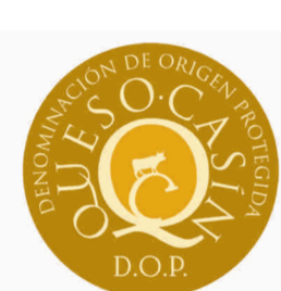
Queso Casín (DOP) ASTURIAS