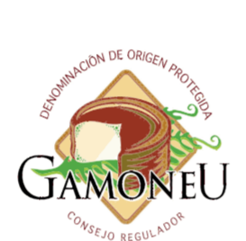
Gamonedo (DOP) ASTURIAS