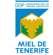
Miel de Tenerife (DOP) CANARIAS