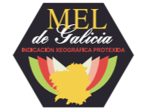
Miel de Galicia (IGP) GALICIA