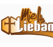
Miel de Liébana (DOP) CANTABRIA