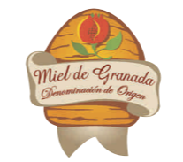
Miel de Granada (DOP) ANDALUCÍA