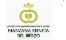
Manzana Reineta del Bierzo (DOP) CASTILLA Y LEÓN