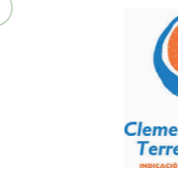
Clementinas de las Tierras del Ebro (IGP) CATALUÑA