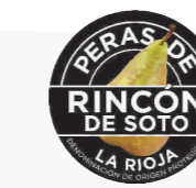
Peras de Rincón de Soto (DOP) LA RIOJA