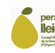
Pera de Lleida (DOP) CATALUÑA