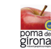
Manzana de Girona (IGP) CATALUÑA