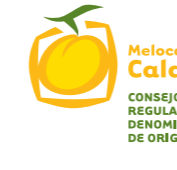
Melocotón de Calanda (DOP) ARAGÓN