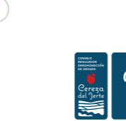
Cereza del Jerte (DOP) EXTREMADURA