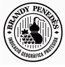
Brandy del Penedés CATALUÑA