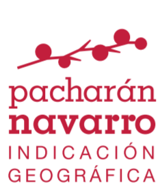
Pacharán navarro NAVARRA