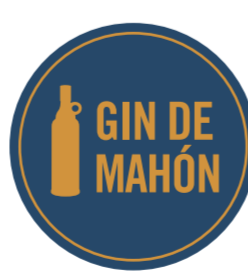
Gin de Mahón ISLAS BALEARES