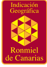
Ronmiel de Canarias CANARIAS