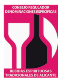
Herbero de la Sierra de Mariola COMUNIDAD VALENCIANA