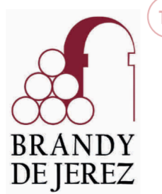
Brandy de Jerez ANDALUCÍA