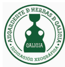
Aguardiente de Hierbas de Galicia GALICIA