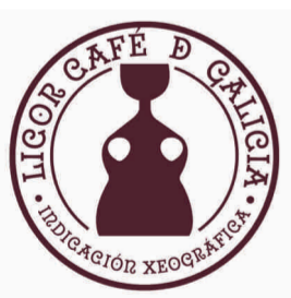
Licor Café de Galicia GALICIA