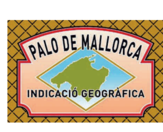
Palo de Mallorca ISLAS BALEARES