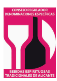
Aperitivo Café de Alcoy COMUNIDAD VALENCIANA