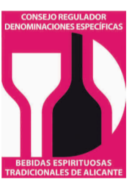
Cantueso Alicantino COMUNIDAD VALENCIANA