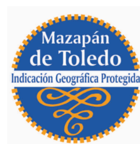
Mazapán de Toledo CASTILLA-LA MANCHA