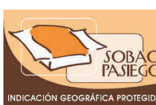
Sobao Pasiego CANTABRIA