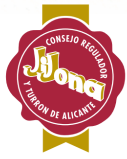
Jijona COMUNIDAD VALENCIA