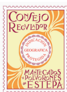
Polvorones de Estepa ANDALUCÍA