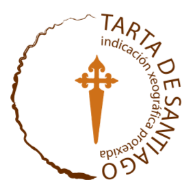
Tarta de Santiago GALICIA