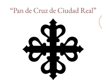
Pan de Cruz de Ciudad Real CASTILLA-LA MANCHA