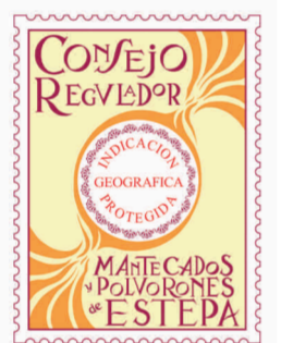
Mantecados de Estepa ANDALUCÍA