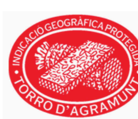
Turrón de Agramunt CATALUÑA