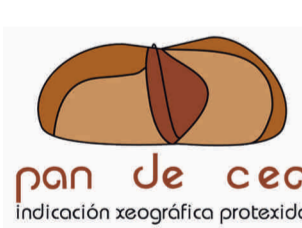
Pan de Cea GALICIA