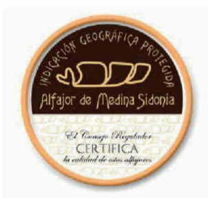
Alfajor de Medina Sidonia ANDALUCÍA