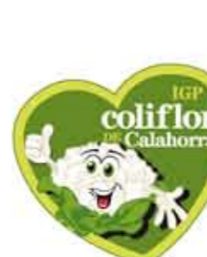
Coliflor de Calahorra LA RIOJA (IGP)