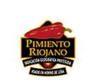
Pimiento Riojano LA RIOJA (IGP)