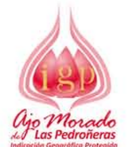
Ajo Morado de Las Pedroñeras CASTILLA -LA MANCHA (IGP)