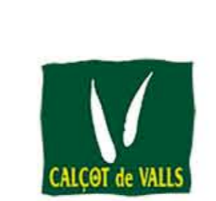
Calçot de Valls CATALUÑA (IGP)