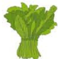
Grelos de Galicia GALICIA (IGP)