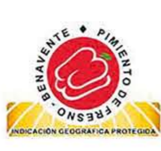
Pimiento de Fresno - Benavente CASTILLA Y LEÓN (IGP)