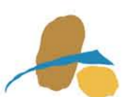
Patata de Galicia GALICIA (IGP)