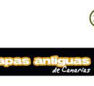
Papas Antiguas de Canarias CANARIAS (DOP)