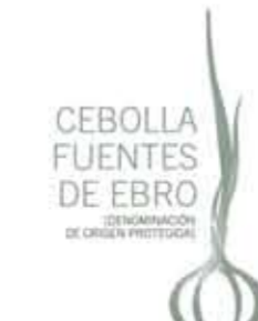
Cebolla Fuentes de Ebro ARAGÓN (DOP)