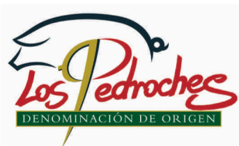
Los Pedroches (DOP) ANDALUCÍA