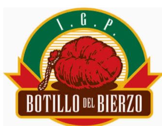
Botillo del Bierzo (IGP) CASTILLA Y LEÓN