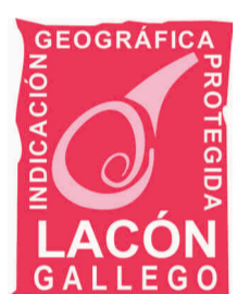
Lacón Gallego (IGP) GALICIA