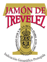
Jamón de Trevélez (IGP) ANDALUCÍA