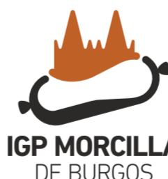
Morcilla de Burgos (IGP) CASTILLA Y LEÓN