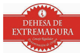
Dehesa de Extremadura (DOP) EXTREMADURA