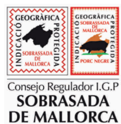
Sobrasada de Mallorca (IGP) ISLAS BALEARES