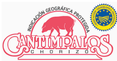
Chorizo de Cantimpalos (IGP) CASTILLA Y LEÓN