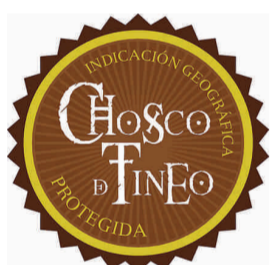
Chosco de Tineo (IGP) ASTURIAS