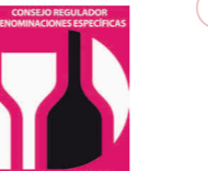
Aperitivo Café de Alcoy COMUNIDAD VALENCIANA