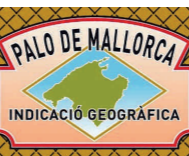
Palo de Mallorca ISLAS BALEARES