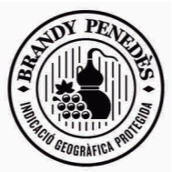
Brandy del Penedés CATALUÑA