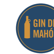
Gin de Mahón ISLAS BALEARES