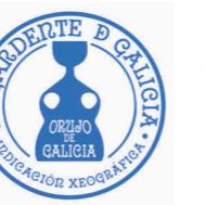
Orujo de Galicia GALICIA