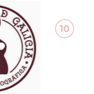
Licor Café de Galicia GALICIA