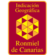
Ronmiel de Canarias CANARIAS