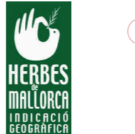
Hierbas de Mallorca ISLAS BALEARES