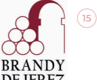
Brandy de Jerez ANDALUCÍA