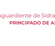
Aguardiente de Sidra de Asturias PRINCIPADO DE ASTURIAS